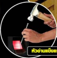
หัวอ่านแข็งแรง แม่นยำ